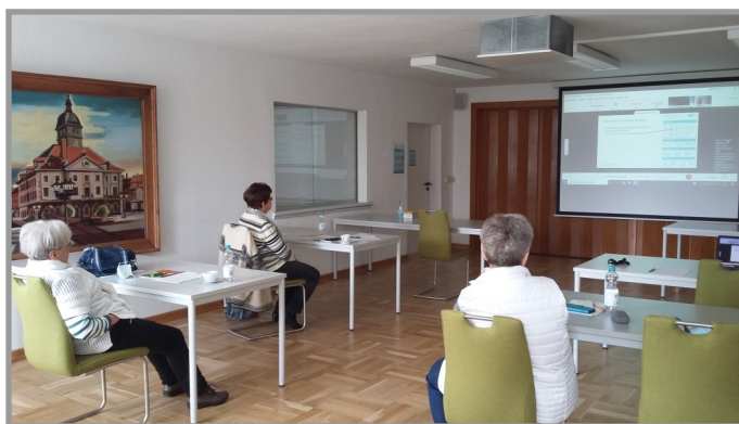
Public-Viewing in den Veranstaltungsräumen im Haus der Grünen Verbände in Erfurt

Herzlichen Glückwunsch an alle Teilnehmer und Dank an die fleißigen Organisatorinnen!